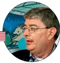
Dr George Weigel

Amerykański prawnik, Najwyższy Rycerz Zakonu Rycerzy Kolumba, w latach 1983-87 pracował w gabinecie Prezydenta USA, był też członkiem Komisji Praw Obywatelskich Stanów Zjednoczonych, wykładał na Papieskim Uniwersytecie Laterańskim w Rzymie.