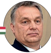
Viktor Orbán, premier Węgier

Menedżer, bankowiec i polityk, były prezes zarządu Banku Zachodniego WBK, wiceprezes Rady Ministrów (2015-17), minister rozwoju (2015-16), minister rozwoju i finansów (2016-18), od 2017 prezes Rady Ministrów.