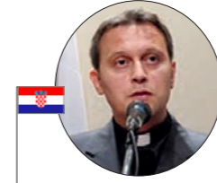
Ks. prof. Ivica Žižić

Lider polskiej społeczności na Litwie. Prezes Akcji Wyborczej Polaków na Litwie – Związku Chrześcijańskich Rodzin. Posel do Parlamentu Europejskiego. Posel na Sejm Republiki Litewskiej. Autor przedłożonej w parlamencie litewskim ustawy o ochronie życia poczętego.