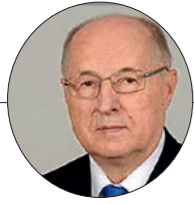
Prof. dr hab. Michał Seweryński