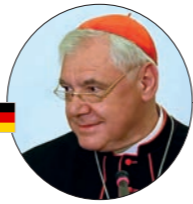
Kard. Gerhard Ludwig Müller

Polityk i prawnik, od 1990 r. poseł do Zgromadzenia Narodowego (ośmiu kolejnych kadencji), przewodniczący Fideszu w latach 1993–2000 i od 2002, premier Węgier w latach 1998–2002 i od 2010 r.