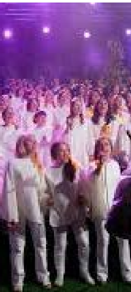
Chór „Jednego Serca Jednego Ducha”

Wokalistka ukraińskiego zespołu KANA. Jej miłość do tradycji ludowych przekłada się ciekawie na styl jej śpiewania – potrafi łączyć głąb muzyki ludowej ze współczesnymi stylami. Jest nie tylko muzykiem, ale także organizatorem edukacyjnych programów muzycznych.